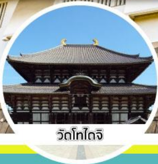
วัดโทไดจิ