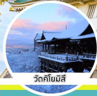
วัดคิโยมิตสึ